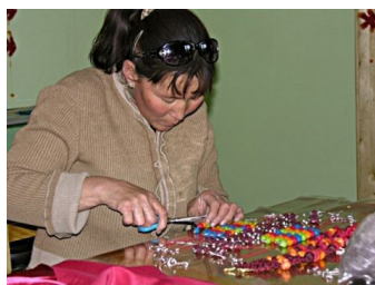
ARTISANE AU TRAVAIL

Son but est de donner l'opportunité aux personnes locales sans ou avec peu de revenus, de développer de l'artisanat typique et de le commercialiser. Altai connaît un taux de chômage élevé. ArtisAltai se veut solidaire avec la population d'Altai, particulièrement les mères de famille qui élèvent souvent seules leurs enfants et n'ont aucune chance de trouver un travail adapté à leur situation. ArtisAltai les aide à retrouver espérance, confiance et dignité par une activité professionnelle.