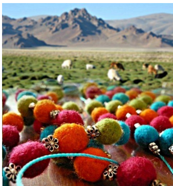
PRÉSENTATION DE BIJOUX